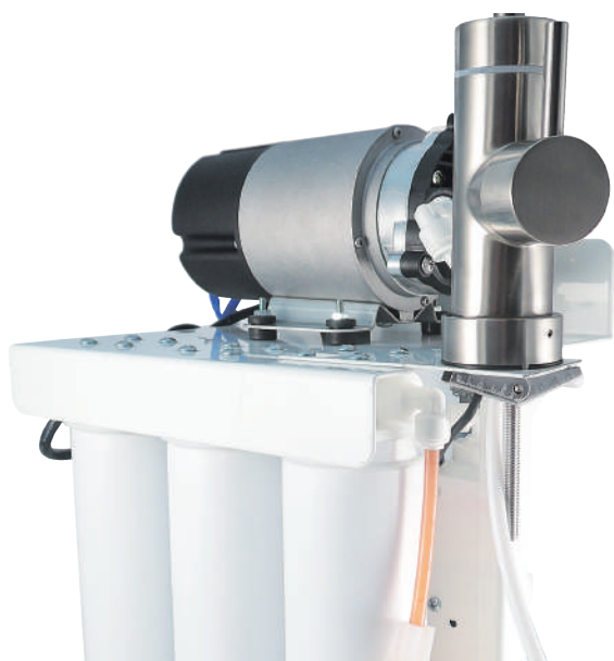
功能整合至泵浦內，讓系統線路更簡潔