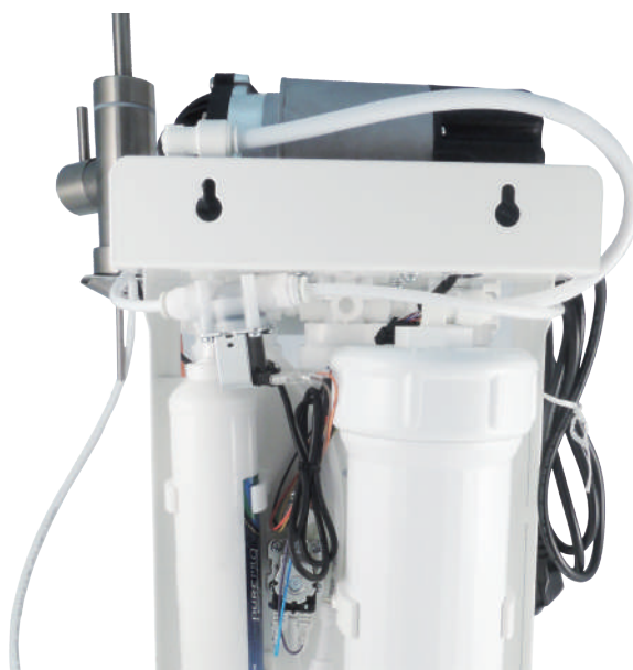
無進水壓力開關及線路